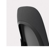
Sitz- und Rückenlehnenstütze