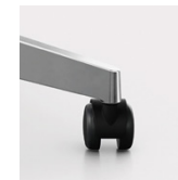
5-Arm-Fußkreuz Rollen 50 mm