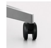
5-Arm-Fußkreuz Rollen 65 mm